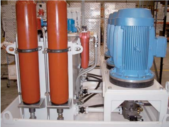
Styria Impormol Linha Parabólica n.º 4

A Gustavo Cudell concebe e fornece um Sistema de Accionamento Hidráulico e respectivo Sistema de Comando para uma linha de laminagem de molas parabólicas, instalada na empresa multinacional Styria Impormol. Actualmente a Styria é o líder europeu na produção de molas de folha e barras estabilizadoras para veículos comerciais e eixos de reboques.